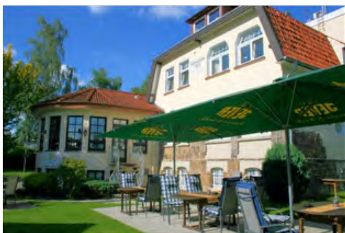
Das Hotel Stadt Hamburg... ... ist Ihr schönes Zuhause auf Zeit.

Das Hotel liegt inmitten der wunderschönen Kurstadt Bad Salzuflen. Zu Fuß erreichen Sie innerhalb von fünf Minuten die wunderschöne Innenstadt sowie den Kurpark mit vielen Sehenswürdigkeiten und Attraktionen. Das hauseigene Day-Spa heißt Sie herzlich willkommen! Die VitaSol Therme und auch die Salzgrotte sind fußläufig sehr gut zu erreichen!