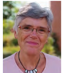
Brigitte Ihre Reisebegleitung

Mitten in Deutschland, zwischen Teutoburger Wald und Weser, liegt das beliebte Staatsbad Bad Salzuflen. Erkunden Sie die historische Altstadt mit ihren bunt verzierten Fachwerkbauten! Auch kulturell hat das Staatsbad viel zu bieten. Musikliebhaber kommen ebenso auf ihre Kosten wie Theaterfreunde. Zudem ist Bad Salzuflen zertifizierter Kneipp-Kurort und wurde darüber hinaus als allergikerfreundliche Kommune ausgezeichnet – eine Stadt, die viel Abwechslung bietet und immer eine Reise lohnt!