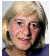
Anne Ihre Reisebegleitung

Die Region Frammersbach liegt im Naturpark Spessart, nahe der Grenze zu Bayern. Frammersbach selbst ist ein anerkannter Erholungsort und bekannt für seine Fuhrmannsgeschichte. Die Region ist der ideale Ausgangspunkt für Unternehmungen jeglicher Art. Besonders Naturverbundene kommen dabei auf ihre Kosten: Direkt am Hotel beginnen wunderbare Rundwanderwege!